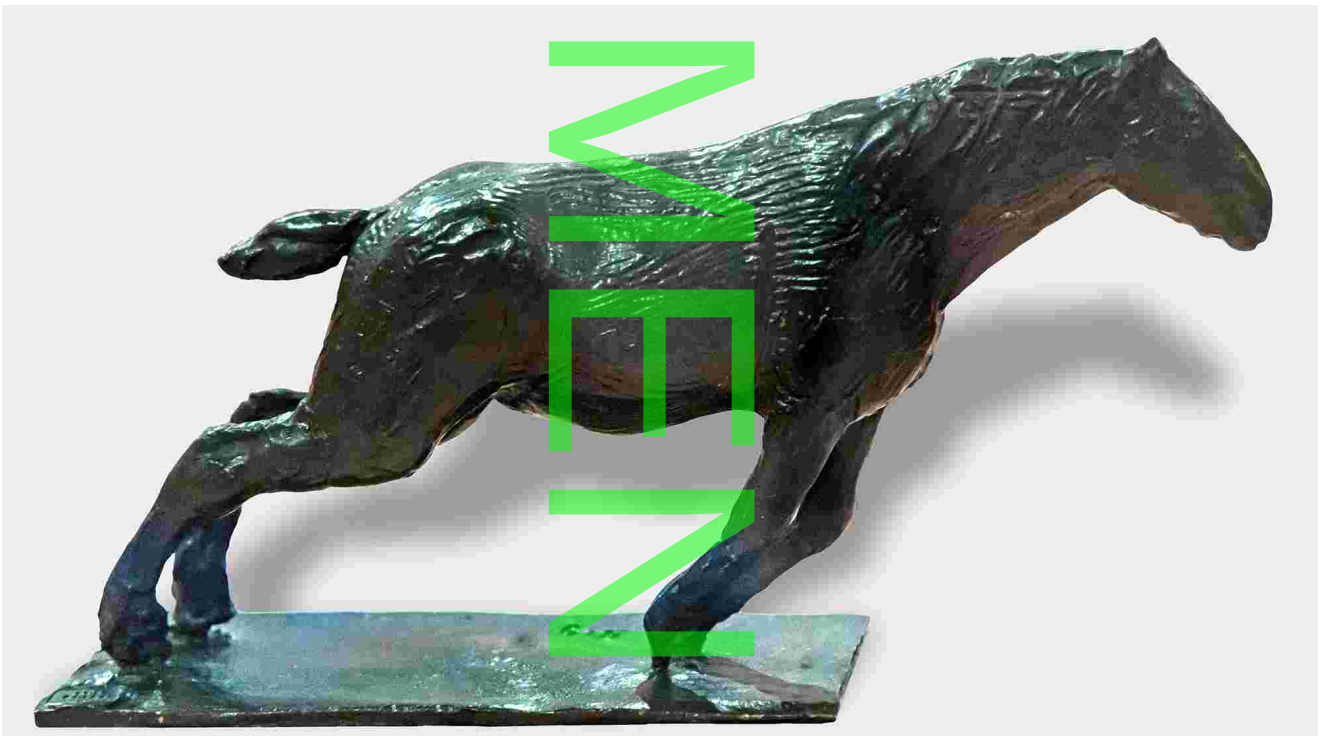
Cheval de trait - Edgar Degas. (Musée d'Orsay).

Nous verrons que l'évolution vers une meilleure sécurité et un confort plus agréable s'est faite très progressivement, que l'hippomobile a donné son aspect et son vocabulaire à l'automobile et a tendance à réapparaître en cette période soucieuse d'écologie.