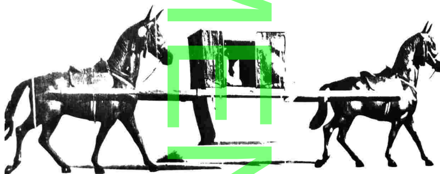
Chaise muletière inventée par Vauban

La chaise muletière était à la fois tirée et portée par des mules ou mulets, parfois par des chevaux. Connue dès l'Antiquité, plus confortable que les voitures, du fait de l'absence de roues, la litière où le voyageur n'est pas forcément couché était notamment utilisée par les femmes, les vieillards ou les malades. Vauban qui voyageait beaucoup pour surveiller les travaux de ses places fortes fut un adepte de ce type de transport. « Il fait aménager à l'intérieur un bureau sur lequel il peut écrire pendant ses longs trajets. Il place à portée de la main une petite bibliothèque.[...] Dans un autre coin de sa litière, il dispose tout le matériel dont il peut avoir besoin pour son travail d'ingénieur. 4 »